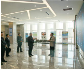
开展《山东省知识产权保护... 1 2 3 4 5